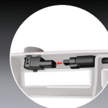
Sensoren mit Plug&Play wieder anschließen