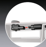
Opnieuw aansluiten sensoren middels Plug & Play