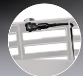
Opnieuw aansluiten aan het voertuig

Let op: Connect + is momenteel alleen beschikbaar voor een beperkt aantal voertuigen.